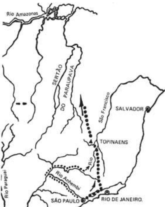
BERTRAN, Paulo. História da terra e do homem no planalto central: eco-história do Distrito Federal, do indígena ao colonizador . Brasília: Verano, 2000, p. 41.

As partes marcadas com pontilhados e setas correspondem ao